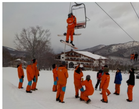
▲リフト救助訓練実施